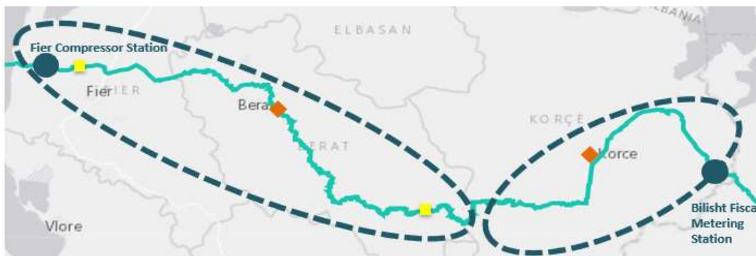
Figura 2: Ndarja e tubacionit në dy zona kryesore

Tubacioni që kalon territorin është rreth 215 km, i cili fillon nga kufijtë jug-lindorë me Greqinë dhe përfundon në bregdetin e detit Adriatik. Tubacioni përbëhet nga dy zona kryesore, zona e Korçës dhe zona e Beratit, Çorovodës dhe Fierit.